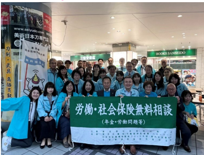
無料街頭相談会（東京交通会館）