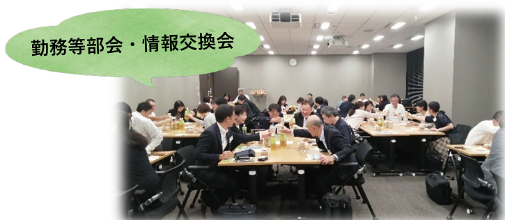
勤務等部会・情報交換会