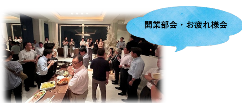
開業部会・お疲れ様会